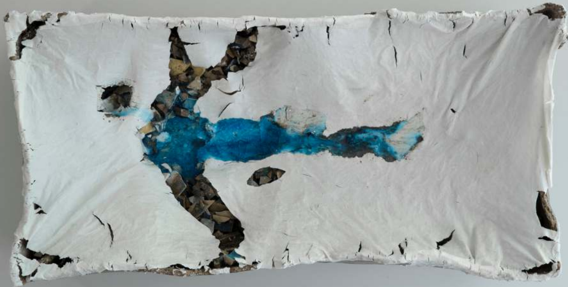
Song Zhifeng, Preisträger 2022