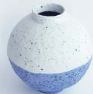
Hyojung Yun, Belobigung 2022